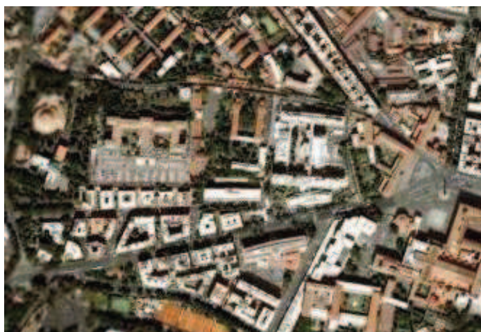
PLANIMETRIA GENERALE PRESIDI Complesso Ospedaliero San Giovanni - Addolorata